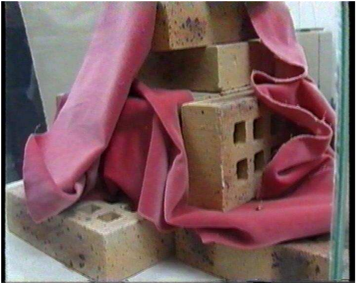
Simulacre d'une façon de construire et d'une façon de penser: (II) entre velours et briques

Ed. Morin : « la création est seulement et nécessairement le fait de « déviants ». 11/03/05