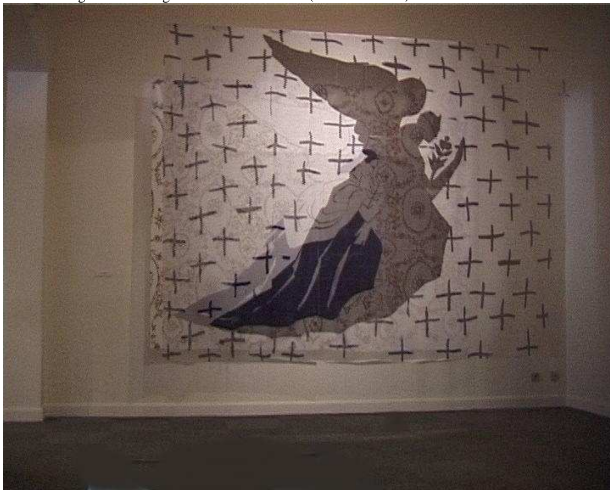
Les deux Anges- un voile, un tissu thermoimprimés (Patrice Hugues- Musée d'Angers de la Tapisserie contemporaine)

Comme le langage, la foi bénéficie très probablement de prédispositions neuronales innées transmises génétiquement, « héritées », qui en favorisent pour une part l'avènement et l'entretien, et pour une autre part elle dépend de dispositions neuronales « acquises » transmises par la tradition qu'elle confirme de génération en génération. 15-16/04/06 (v. aussi 08/05/03)