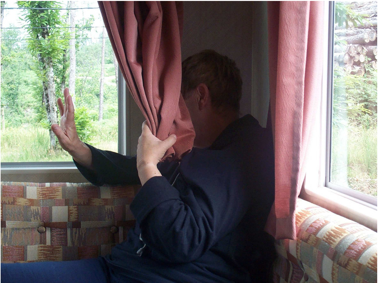
Le tissu entre la conscience et le vivant

Toute pensée, tout sentiment, toute détermination, tout état de conscience est l'entrée en relation et en activité d'un réseau neuronal qui se constitue et s'active ou se réactive en même temps qu'il les constitue et les active. 27/12/04