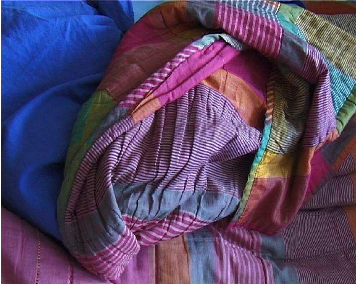
III. n° 4 bis – Ch. 9

sont le possible passage à niveau manquant jusque là (l'Église, multimédia avant la lettre, y ressemblait déjà en partie) .