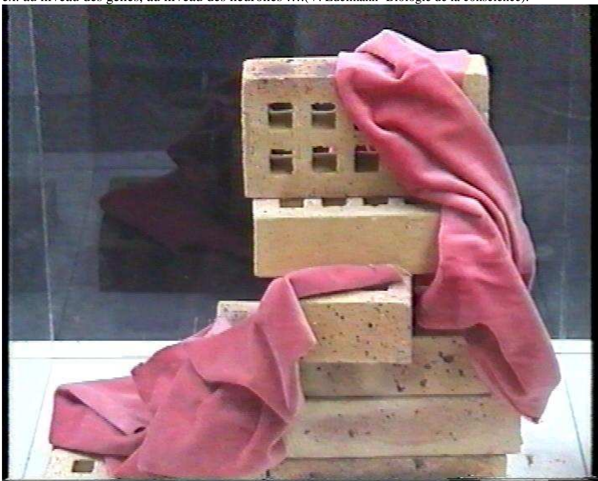
Simulacre d'une façon de construire et d'une façon de penser: entre velours et briques(I)

- Ne pas se limiter au sens donné à épigenèse par les seuls généticiens qui ne s'occupent que des variantes dites épigénétique de fonctionnement des gènes. L'épigenèse vaut pour toutes les étapes de constitution d'un système vivant – y compris du système nerveux – qui surviennent « hors toute préformation » en rapport singulier avec les autres composantes de ce système, conditionnées seulement par les étapes précédentes et les adaptabilités nécessaires à l'externe, aux conditions de vie ménagées par l'environnement. Y compris pour les neurones, agencements toujours en route, provisoires, réactivables, recomposables, au niveau des synapses entre d'innombrables connexions possibles, et pour chacun différents, par certains côtés, même si le fond des modalités d'agencement est commun à tous ceux de l'espèce. Agencements indiscernables à l'observation car plusieurs sont superposés ou diversement enchevêtrés. On parle de plasticité des agencements et fonctionnements : ex. au niveau des gènes, au niveau des neurones ... (V. Edelman- Biologie de la conscience).