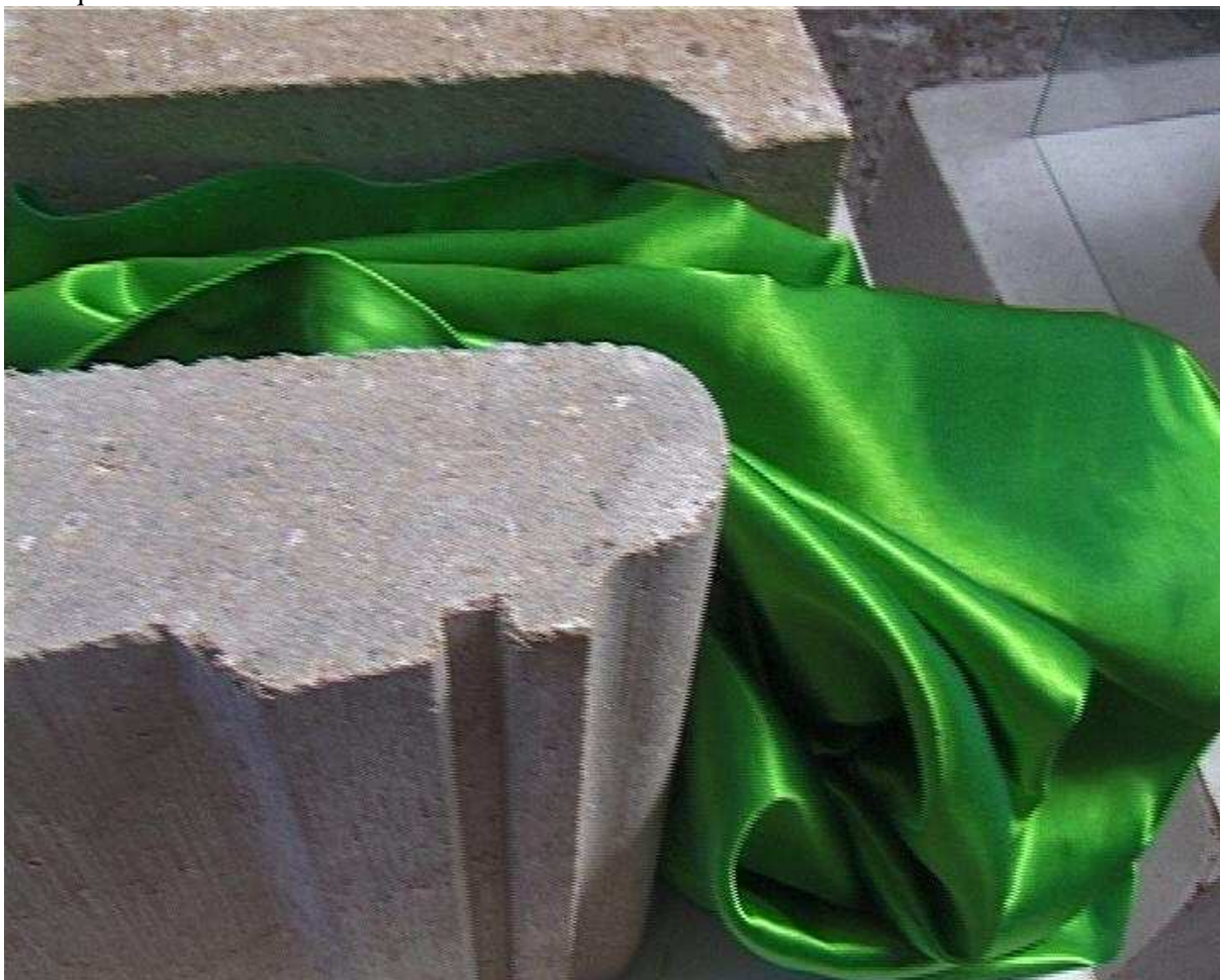
Le satin vert tient position dans l'Entre-deux (I)

Certainement l'acte sexuel jusqu'à l'instant du mélange le plus intime de la femme et de l'homme, jusqu'à l'instant du paroxysme, est la seule séquence où le rapport du sentiment et de la chair est pleinement vécu, pleinement consenti et peut être consciemment admis dans le flux affectif entre-deux qui est la tendresse.