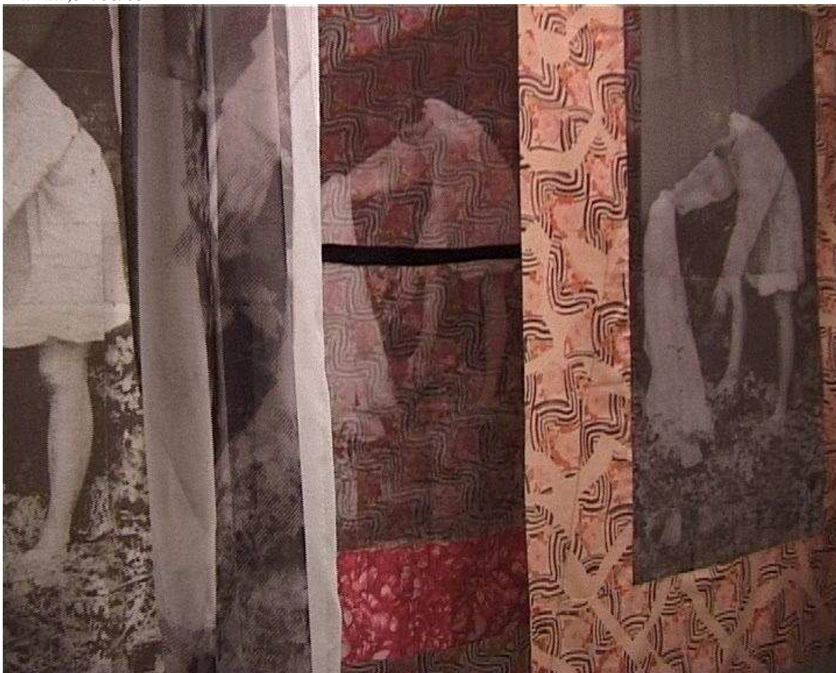
Dans l'entre-deux de l'espace, voiles et tissus, Gestes de Tissu, Gestes d'aide (Patrice Hugues – Musée d'Angers de la Tapisserie contemporaine)