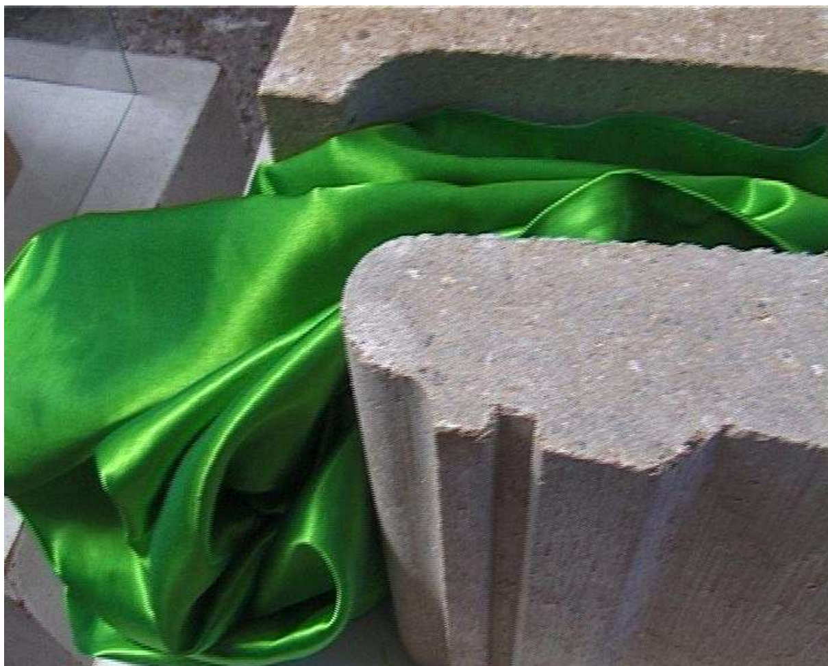
Le satin vert change sa position entre-deux (II) malgré la pression

Il ne faut pas se tromper d'avenir , les passages, ils ne peuvent se trouver qu'en suivant l'entre-deux . Mais avancer dans l'entre-deux cela ne veut pas dire compromis à tout prix, cela veut dire recherche des compositions positives, cela veut dire esprit de composition (pas plus que de son côté l'esprit de synthèse, également nécessaire, ne veut dire esprit de système).(v. chap. 9 Des façons de penser )05/04/07