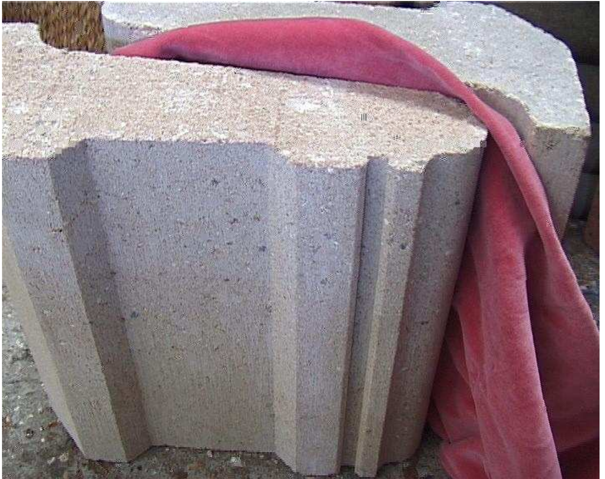
Velours rose pris dans les pressions du béton